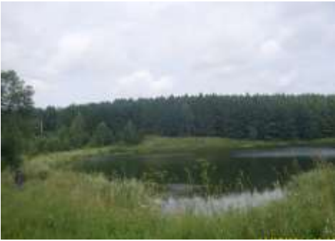
Село Отрадное. Пруд.