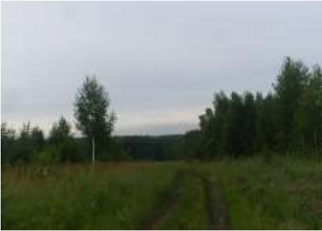
Мишихинская грань, далеко впереди село Жуланиха.