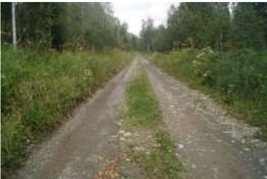
Как хорошо идти в Тоголёнок по дороге.