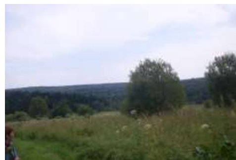
Окрестности бывшей деревни Кружало.