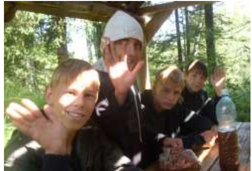
Оборудованная таёжная охотничья стоянка. Навес на месте гибели охотника. Река Сунгай.