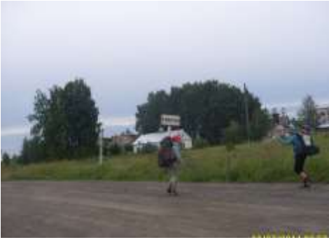
Вперед к вокзалу.