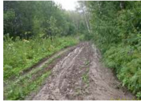
Дорога в село Отрадное из ур. Проскуриха.