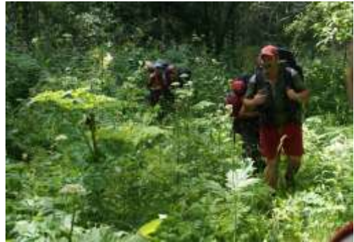
Движение на перевал через Тягунский хребет.