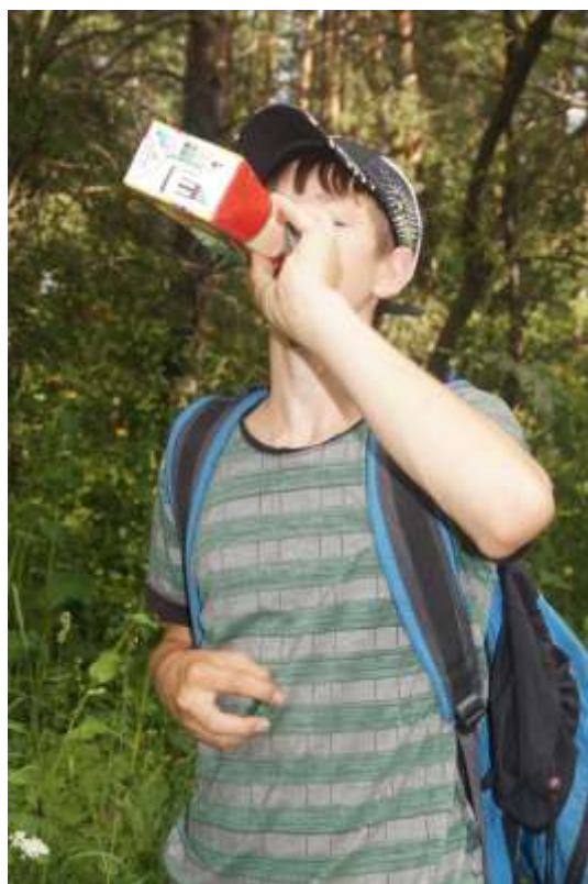
Таёжные красоты. Окрестности Анатолия.