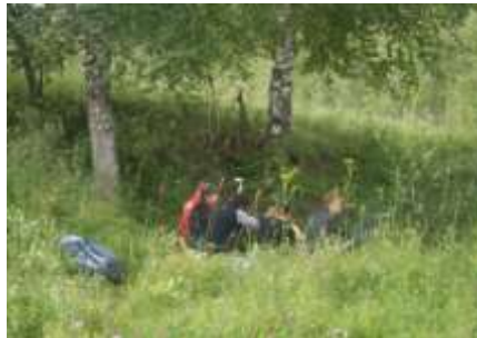
Ночёвка на берегу пруда в селе Отрадное.