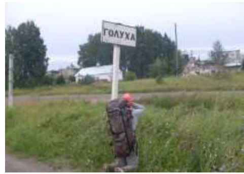
Конечная цель пешеходного маршрута.