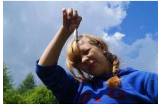
Будни туристской жизни.