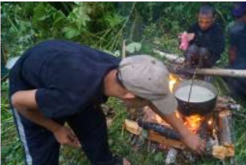
Дорога найдена. Тогулёнок.