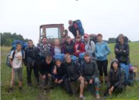
Подъезд на маршруте: село Отрадное-Мишихинская грань.